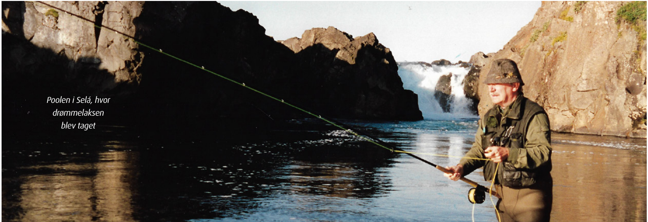
Poolen i Selá, hvor drømmelaksen blev taget

aldrig den første gang, jeg var ved Omme Å. Jeg havde fanget nogle ørreder og havde taget sådan en lille ABU-røgeovn med, og da fik jeg røget ørred til frokost. Så kom der en sulten kat forbi, og den fik resten af ørrederne og lå tromletyk og spandt, da jeg tog derfra.