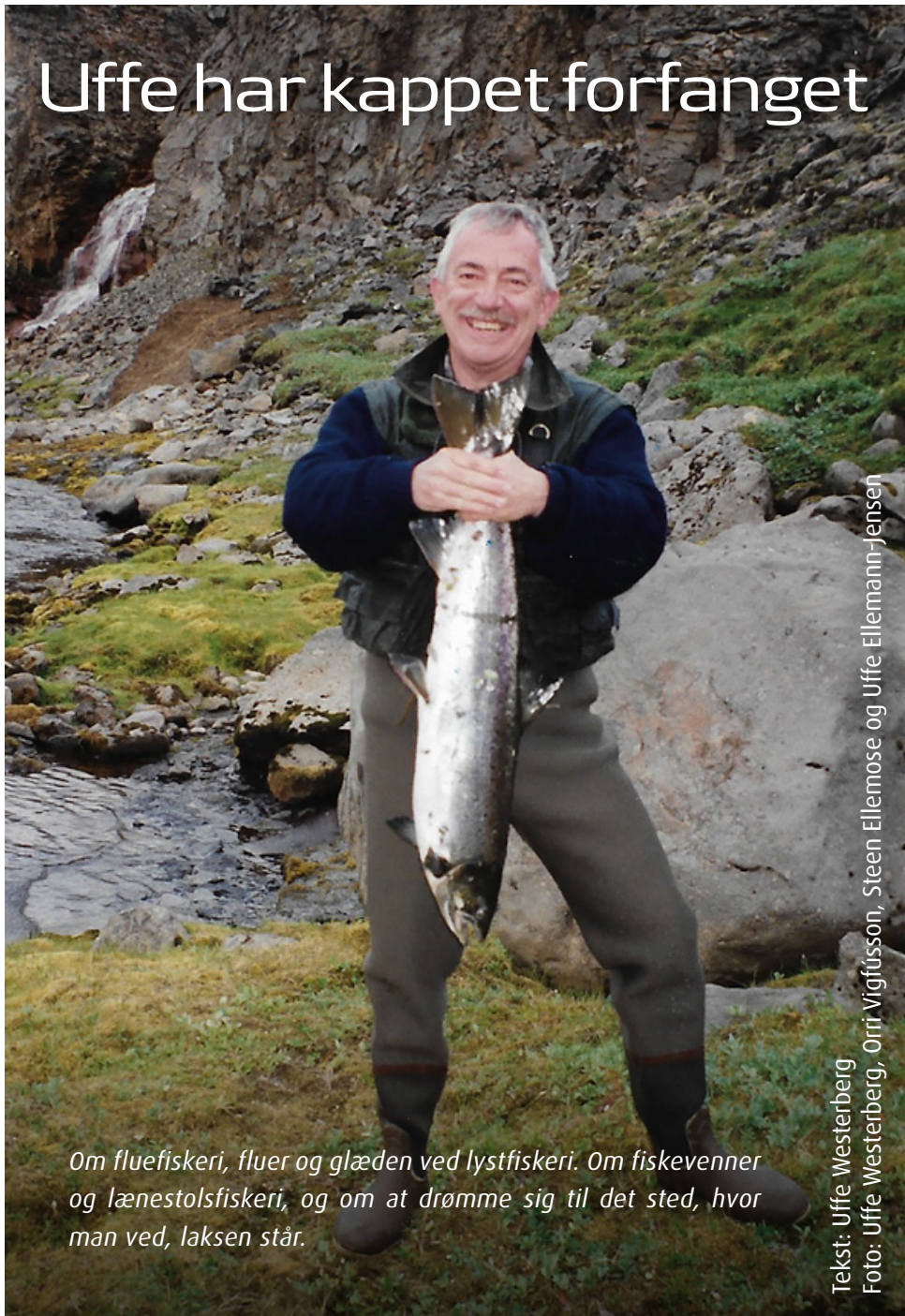
Tekst: Uffe Westerberg

Om fluefiskeri, fluer og glæden ved lystfiskeri. Om fiskevenner og lænestolsfiskeri, og om at drømme sig til det sted, hvor man ved, laksen står.